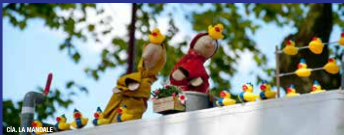
CÍA. LA MANDALE