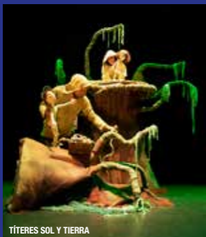
TÍTERES SOL Y TIERRA