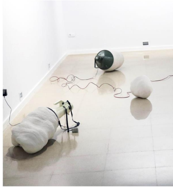
MATERIALIZAR GRITOS_ ACTO DE COMUNICACIÓN Nº35 ( Grito n3, Grito n9, Grito n10) Gres, cocciones 1050°C y 1200°C + Megáfonos + Altavoces exponenciales +reproductores de audio