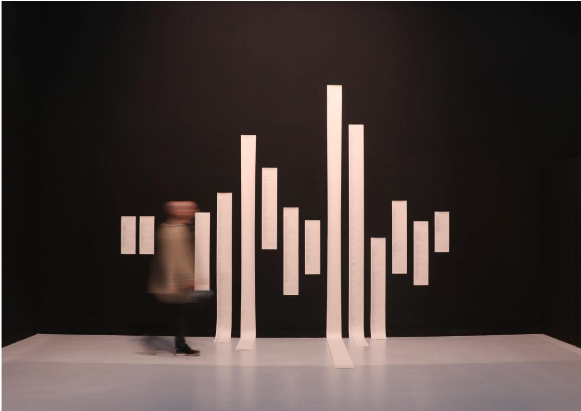
2020 Tinta sobre papel Medidas variables